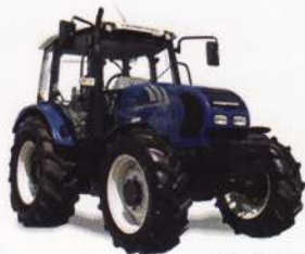
FT 685 DT