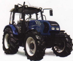
FT 685 DT